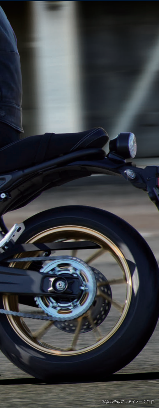
写真は合成によるイメージです。