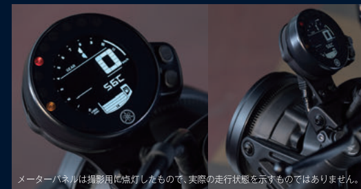
メーターパネルは撮影用に点灯したもので、実際の走行状態を示すものではありません。