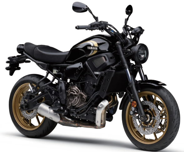
ブラックメタリックX(ブラック)