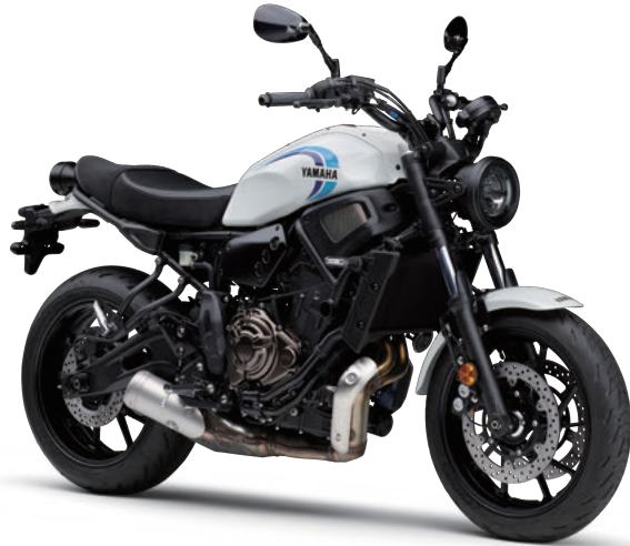
ラジカルホワイト(ホワイト)