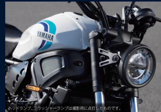
ヘッドランプ、フラッシャーランプは撮影用に点灯したものです。

ボディカラーは新色の2タイプ。ラジカルホワイト(ホワイト)は、往年のヤマハスポーツを彷彿とさせるグラフィックを採用。ブラックのラジエターカラーがエンジンの塊感を印象づけ、さらにホイールにもブラックを採用することでダイナミックな走りを強調している。ブラックメタリックX(ブラック)も、ホワイト同様のニュー・グラフィックを採用。また、ゴールドホイールとブラックのボディカラーとのコンビネーションが精悍なイメージを演出。幅広いライダーにアピールする大きな魅力となっている。